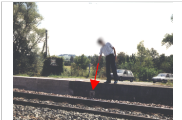
Vue du site BDHE 257 point de repère 325