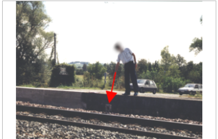
Vue du site BDHE 257 point de repère 325