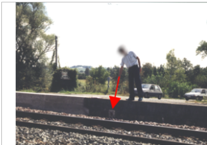
Vue du site BDHE 257 point de repère 325

Coordonnées WGS84 : X: -0.11006080 / Y: 47.29026150