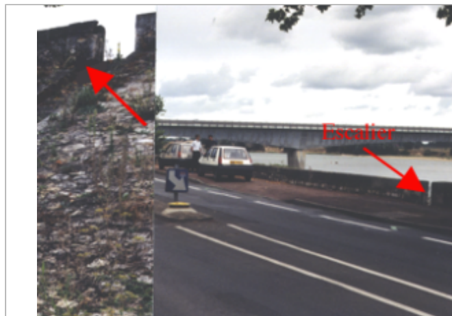
Vue du site BDHE 256 point de repère 324

Coordonnées WGS84 : X: -0.08582740 / Y: 47.26765560