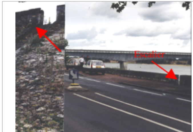
Vue du site BDHE 256 point de repère 324 (source: DIREN Centre)

Coordonnées WGS84 : X: -0.08582740 / Y: 47.26765560