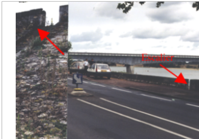
Vue du site BDHE 256 point de repère 324