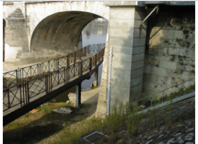
Vue du site BDHE 254 point de repère 320

Coordonnées WGS84 : X: -0.07425021 / Y: 47.26332900