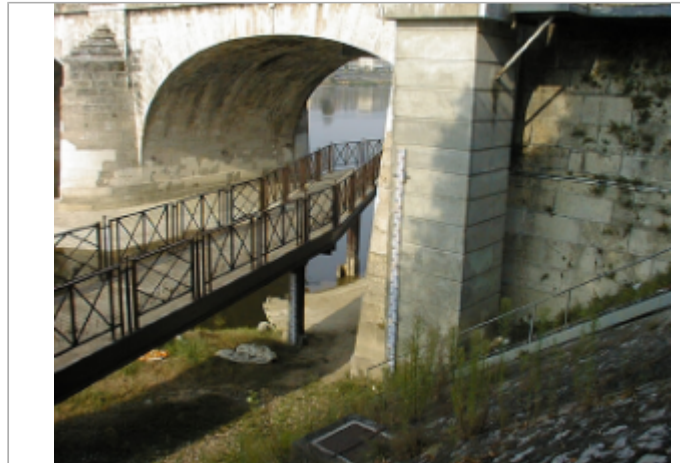
Vue du site BDHE 254 point de repère 320