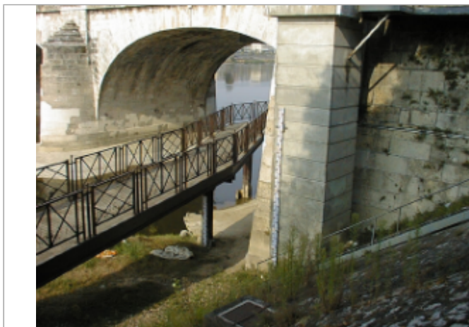
Vue du site BDHE 254 point de repère 320