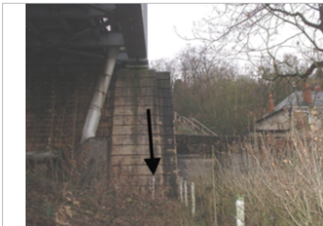
Vue du site BDHE 253 point de repère 319

Coordonnées WGS84 : X: -0.05918020 / Y: 47.25225300