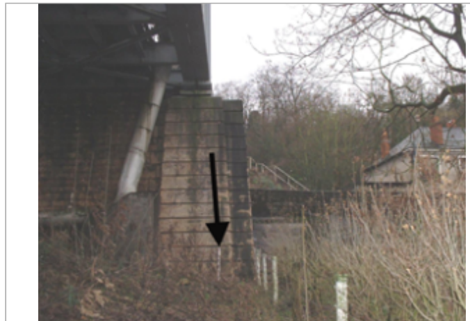
Vue du site BDHE 253 point de repère 319

Coordonnées WGS84 : X: -0.05918020 / Y: 47.25225300