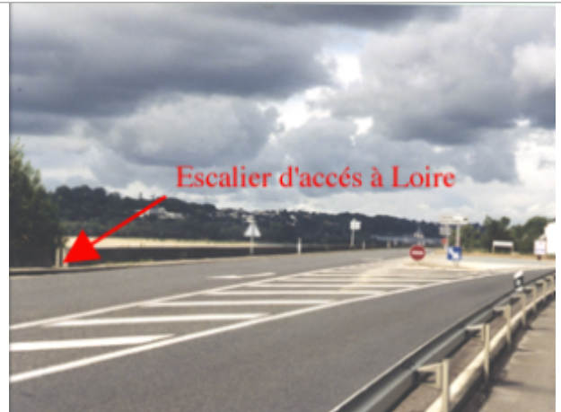
Vue du site BDHE 252 point de repère 318

Coordonnées WGS84 : X: -0.02823930 / Y: 47.25146190