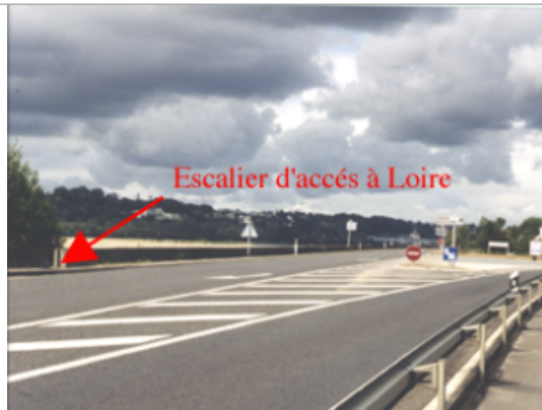
Vue du site BDHE 252 point de repère 318

Coordonnées WGS84 : X: -0.02823930 / Y: 47.25146190