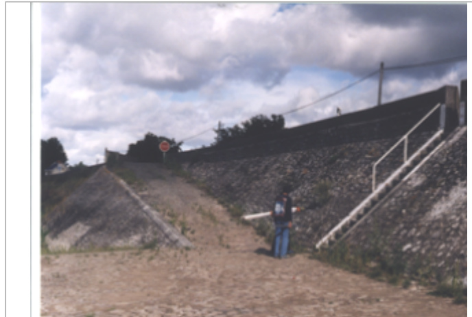
Vue du site BDHE 250 point de repère 316