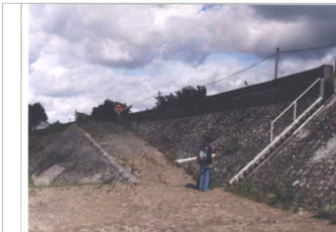
Vue du site BDHE 250 point de repère 316