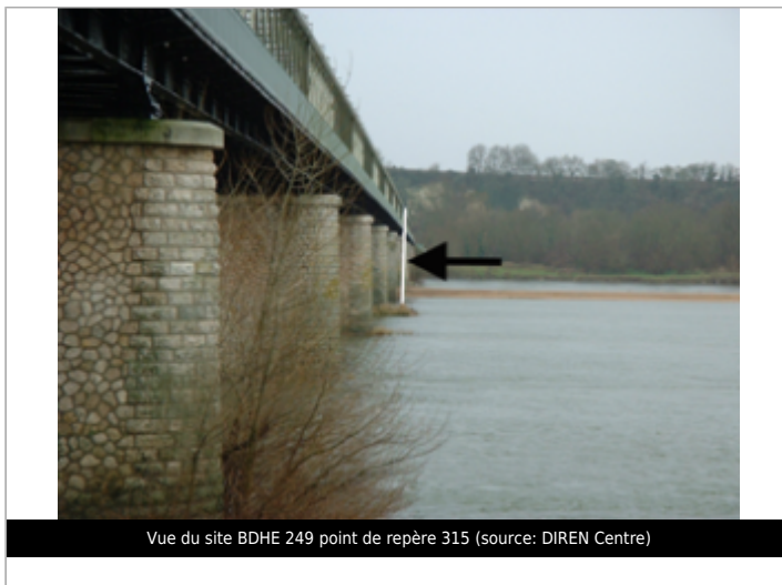
Vue du site BDHE 249 point de repère 315