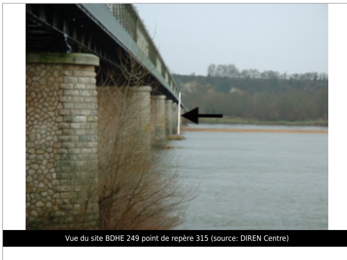
Vue du site BDHE 249 point de repère 315