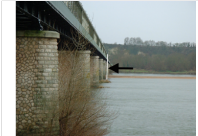
Vue du site BDHE 249 point de repère 315

Coordonnées WGS84 : X: 0.04849432 / Y: 47.22534230