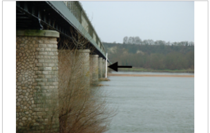
Vue du site BDHE 249 point de repère 315