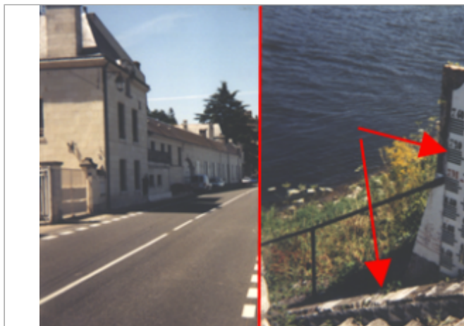
Vue du site BDHE 248 point de repère 314