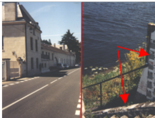
Vue du site BDHE 248 point de repère 314

Coordonnées WGS84 : X: 0.06556098 / Y: 47.21503720