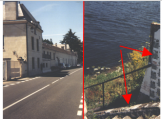
Vue du site BDHE 248 point de repère 314

Coordonnées WGS84 : X: 0.06556098 / Y: 47.21503720