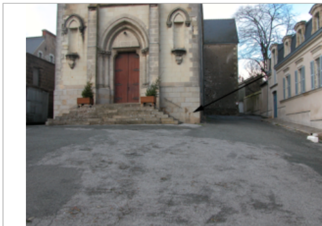
Vue du site BDHE 486 point de repère 789