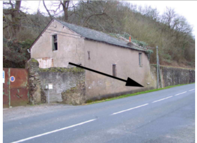
Vue du site BDHE 482 point de repère 782

Coordonnées WGS84 : X: -0.72424460 / Y: 47.34760550