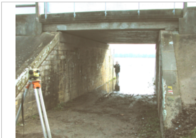
Vue du site BDHE 450 point de repère 695

Coordonnées WGS84 : X: -0.62697985 / Y: 47.39867730