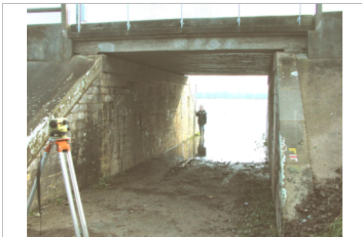
Vue du site BDHE 450 point de repère 695