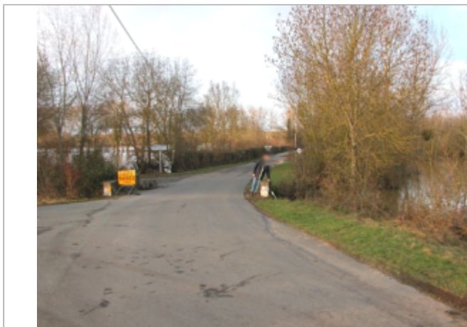
Vue du site BDHE 448 point de repère 693

Coordonnées WGS84 : X: -1.11833510 / Y: 47.35902750