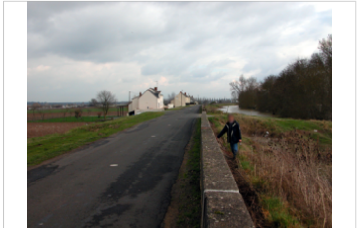
Vue du site BDHE 444 point de repère 790