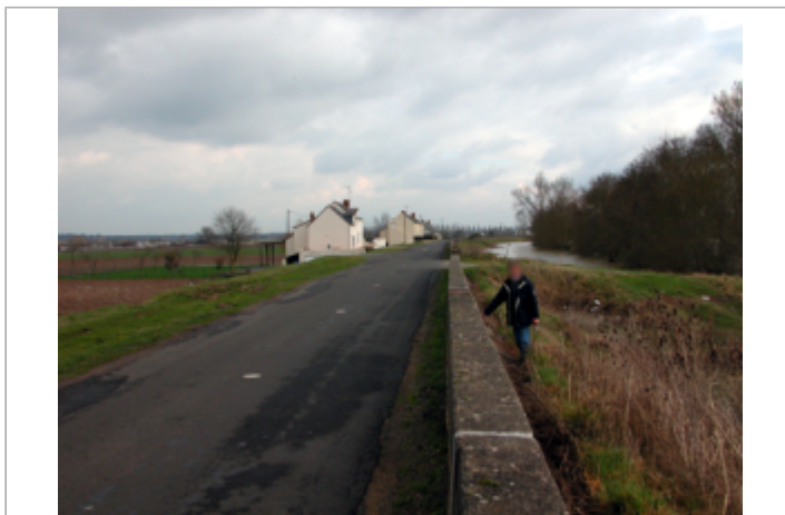
Vue du site BDHE 444 point de repère 790