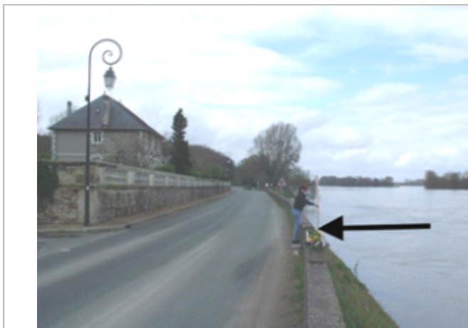
Vue du site BDHE 439 point de repère 682

Coordonnées WGS84 : X: -0.18584300 / Y: 47.32216240