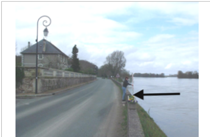
Vue du site BDHE 439 point de repère 682