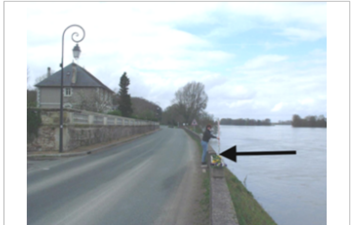
Vue du site BDHE 439 point de repère 682