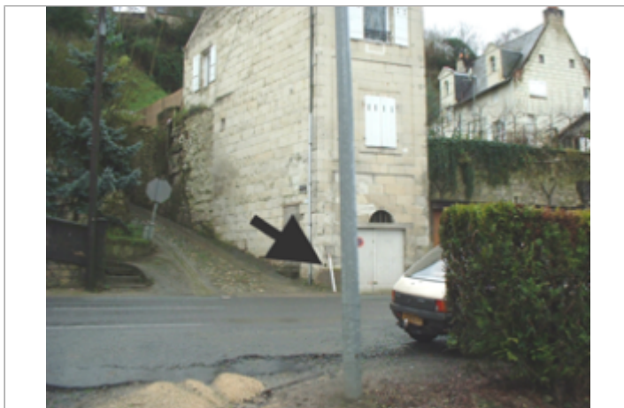
Vue du site BDHE 436 point de repère 679