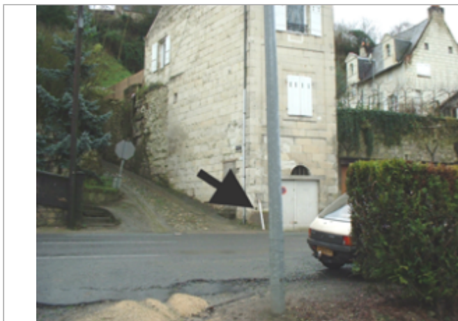
Vue du site BDHE 436 point de repère 679

Coordonnées WGS84 : X: -0.03284800 / Y: 47.24708000