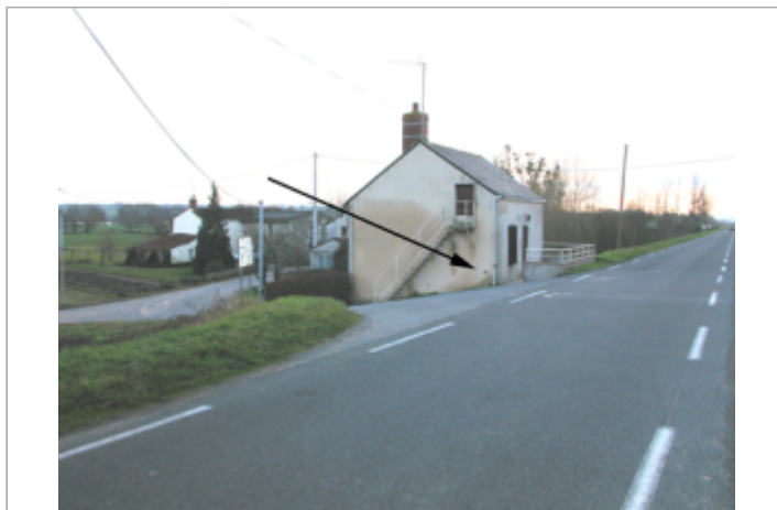
Vue du site BDHE 372 point de repère 530