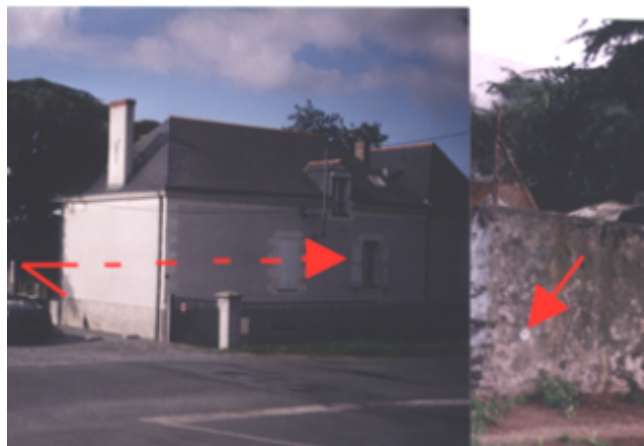
Vue du cheminement topo : BDHE 352 point de repère 492