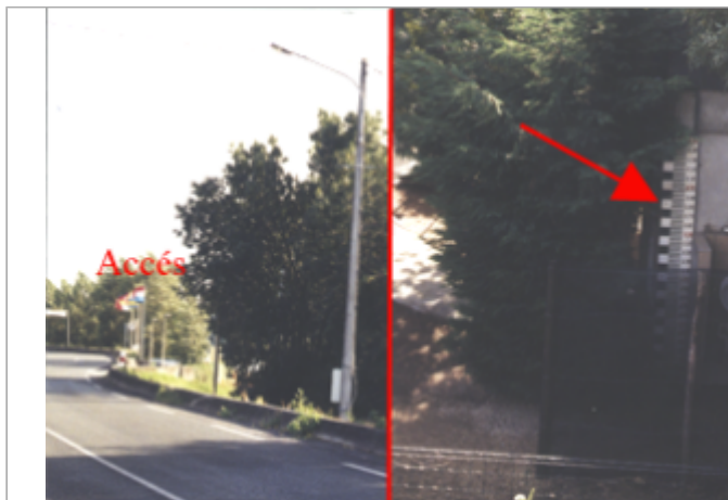
Vue du site BDHE 301 point de repère 396