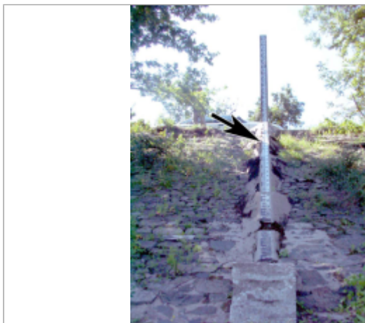
Vue du site BDHE 292 point de repère 449

Coordonnées WGS84 : X: -1.12478420 / Y: 47.36611830