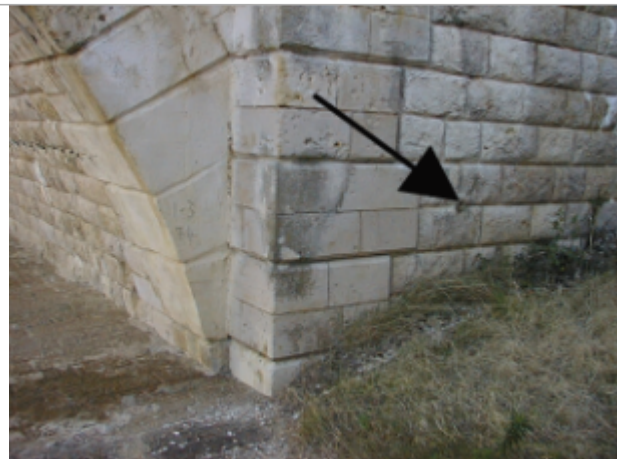
Vue du site BDHE 284 point de repère 354

Coordonnées WGS84 : X: -0.72014450 / Y: 47.35922750