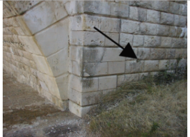
Vue du site BDHE 284 point de repère 354