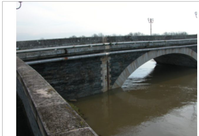
Vue du site BDHE 275 point de repère 342

Coordonnées WGS84 : X: -0.52704720 / Y: 47.42719420