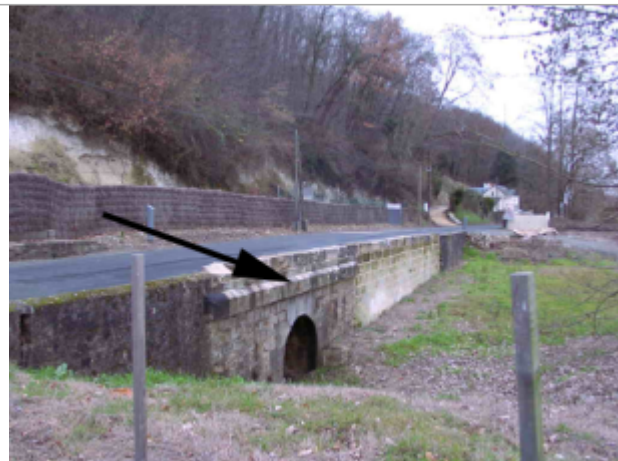
Vue du site BDHE 258 point de repère 326

Coordonnées WGS84 : X: -0.14352490 / Y: 47.30183760