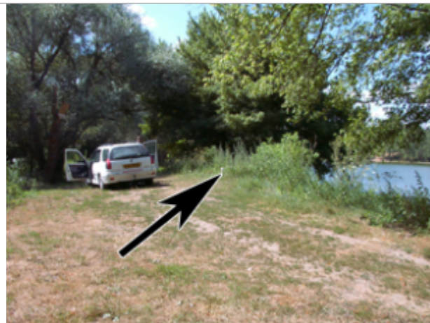
Vue du site BDHE 464 point de repère 659