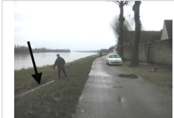
Vue du site BDHE 462 point de repère 641

Coordonnées WGS84 : X: 1.48815114 / Y: 47.65738660