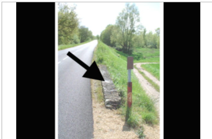
Vue du site BDHE 455 point de repère 705

Coordonnées WGS84 : X: 0.34272071 / Y: 47.28958080