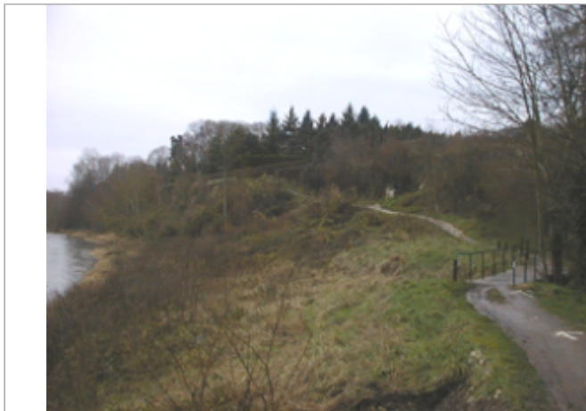
Vue du site BDHE 423 point de repère 642