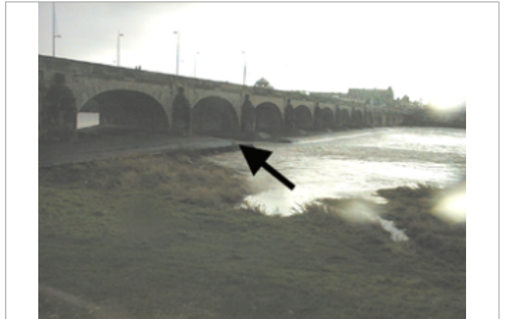
Vue du site BDHE 422 point de repère 643

Coordonnées WGS84 : X: 0.68445633 / Y: 47.40095160