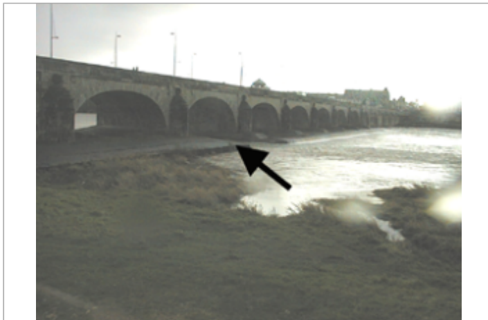
Vue du site BDHE 422 point de repère 643