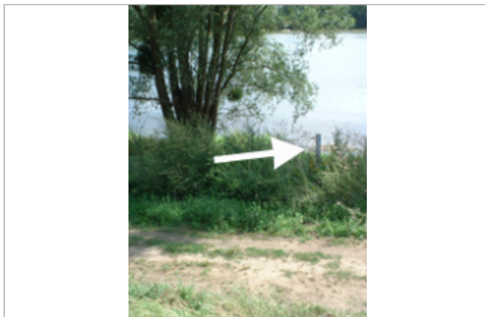
Vue du site BDHE 418 point de repère 636