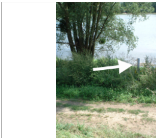
Vue du site BDHE 418 point de repère 636

Coordonnées WGS84 : X: 1.80111901 / Y: 47.86640130