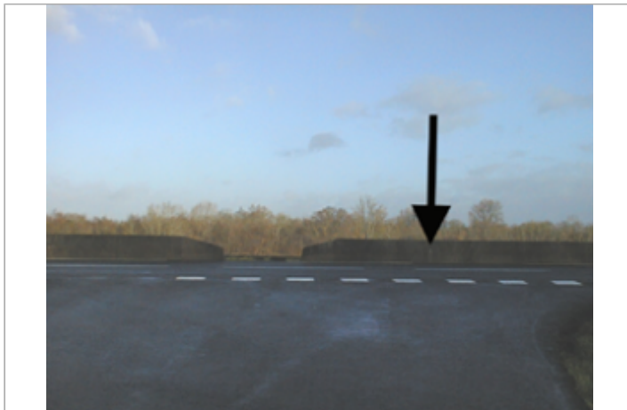
Vue du site BDHE 407 point de repère 608