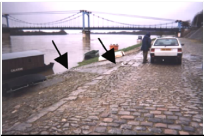
Vue du site BDHE 398 point de repère 138

GÉOLOCALISATION Coordonnées WGS84 : X: 2.22414625 / Y: 47.85979040 Coordonnées RGF93 (Lambert 93) X: 641985 / Y: 6751328.99 Coordonnées RGF93 (ETRS89) : X: 2.2241463 / Y: 47.8597904 Code Hydro: ----0000 Rive de référence: Droite