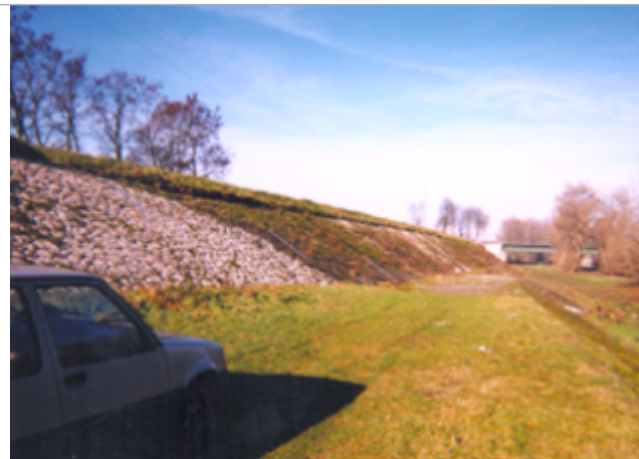
Vue du site BDHE 395 point de repère 583