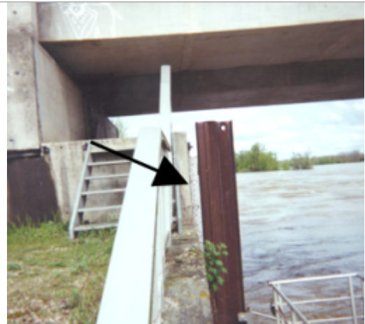
Vue du site BDHE 389 point de repère 562

Coordonnées WGS84 : X: 2.87375385 / Y: 47.51801870