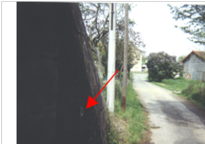
Vue du site BDHE 387 point de repère 558

Coordonnées WGS84 : X: 2.89033735 / Y: 47.51130230