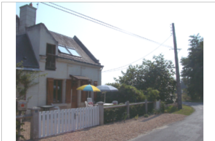
Vue du site BDHE 385 point de repère 548