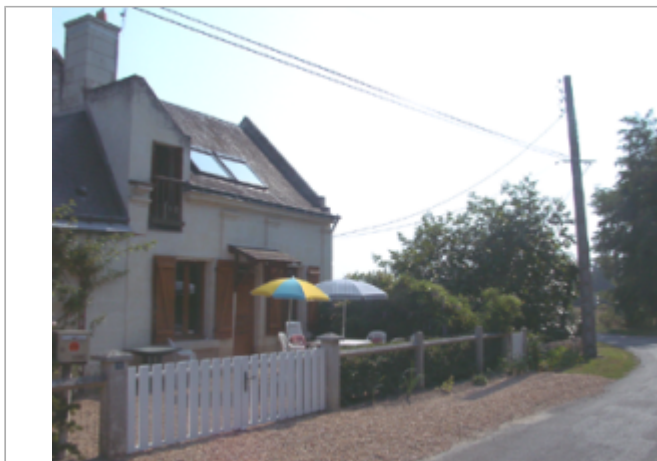
Vue du site BDHE 385 point de repère 548

Coordonnées WGS84 : X: 0.27320762 / Y: 47.26029550